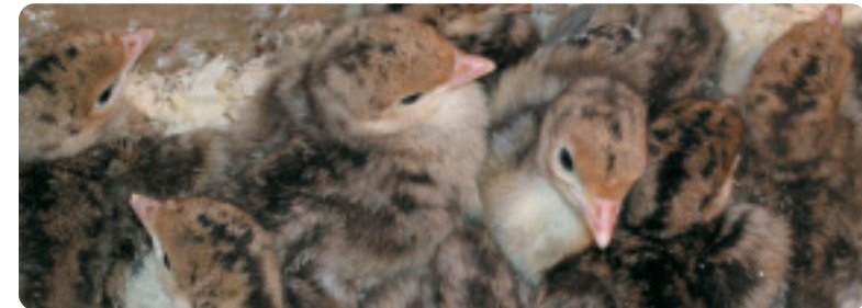
Pavipollo de la raza mostrando su característico plumón de tipo silvestre.

En medio de este panorama, se identifica a finales de 2001 esta población oscense tan singular, que se ha mantenido, casi milagrosamente, al margen del avance de las líneas industriales, probablemente por la calidad de sus productos y por el aprecio que sus criadores tenían a su rusticidad, capacidad reproductora y aspecto altivo y orgulloso.